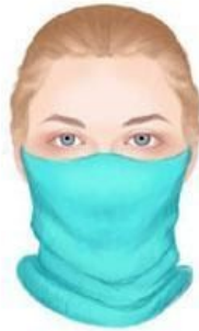
Schal / Halstuch

Sie müssen keine medizinische Schutzmaske tragen. Es genügt auch eine selbstgemachte oder gekaufte Stoffmaske, ein Tuch oder ein Schal um Mund und Nase.